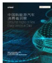
中国新能源汽车 消费者洞察 2017年4月