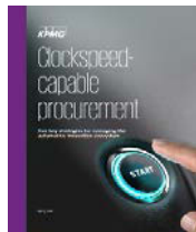
采购部门管理汽车创新 生态的五个战略 2016年12月