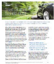
智能汽车， 智能商业模式 2016年11月