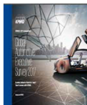
2017年全球汽车行业 高管调查 2017年1月