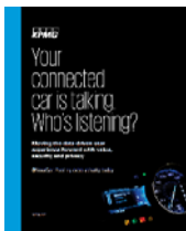
你的网联车讲话了， 谁在听呢 2016年12月