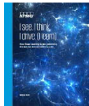
我看见,我思考, 我驾驶(我学习) 2016年12月